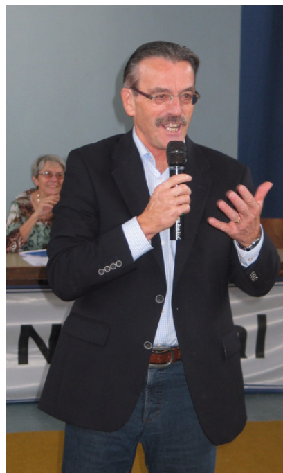
Landkreis Bad Kreuznach Landrat Franz-Josef Diel