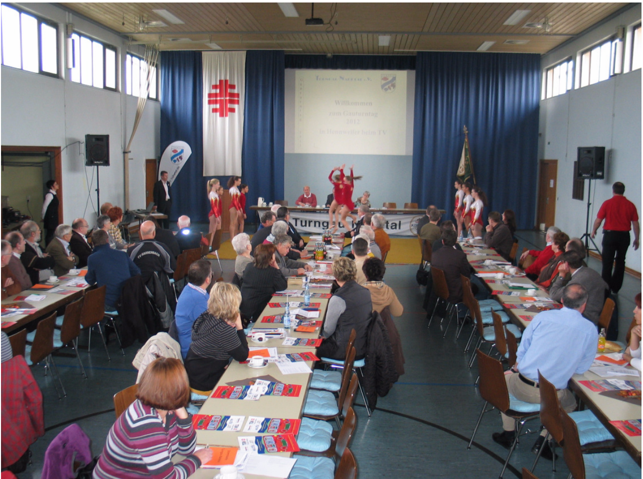
Erstmals war der TV Hennweiler in der Lützelsoonhalle Ausrichter des Gauturntages des Turngaus Nahetal am 01.11.2012