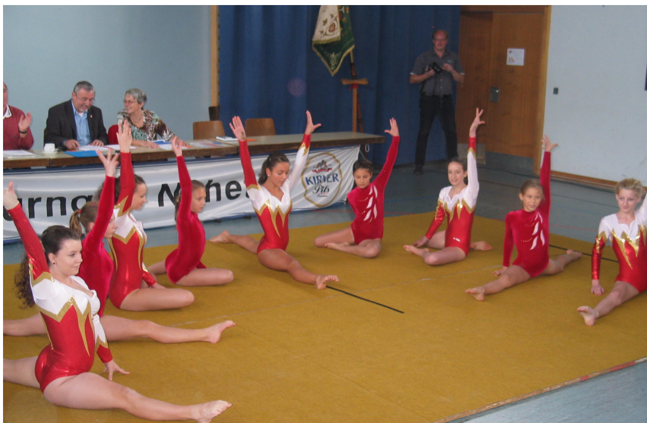
Die Turnerinnen des TV Hennweiler eröffneten mit Bodenübungen den Gauturntag 2012.

Ressortleiter für Öffentlichkeitsarbeit im Turngau Nahetal e.V.